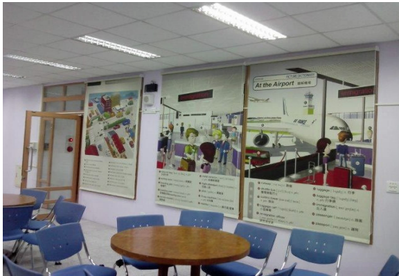
圖 1-1 情境捲簾示意圖