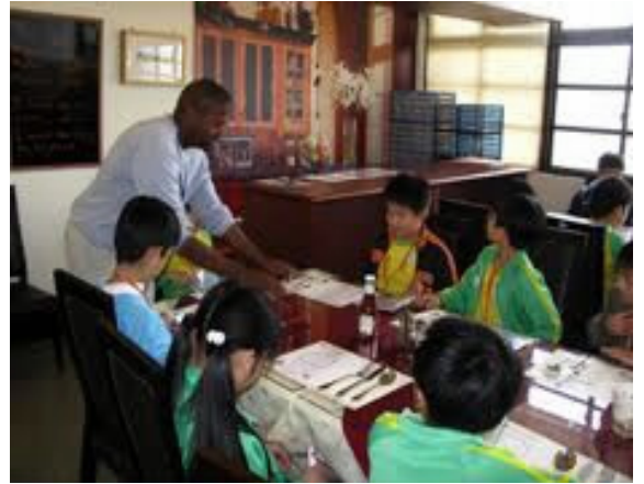
圖 2-1 引進外籍英語教師支援教學示意圖。 圖 2-2 外籍英語教師結合英語情境教室，搭配不同主題授課示意圖。