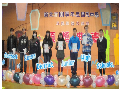
圖3-2 提供學生發表舞台，呈現多元學習成果示意圖。