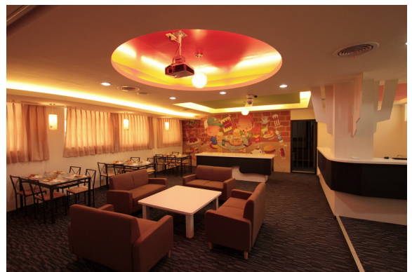
圖 1-4 英語情境佈置示意圖