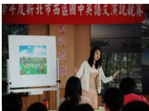
圖3-1 辦英語競賽活動，展現學生學習成效示意圖。