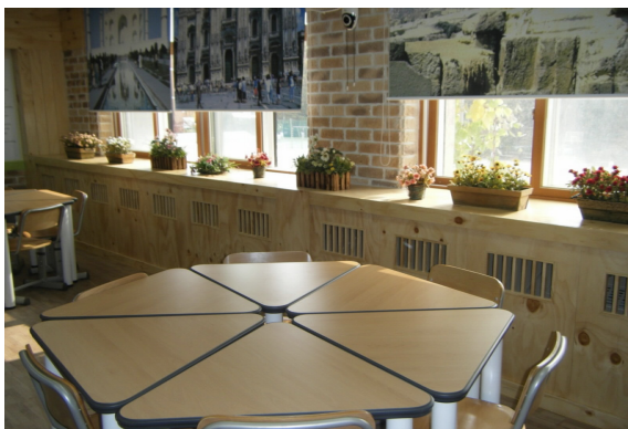
圖 1-3 組合式課桌椅示意圖