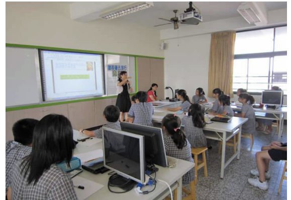
圖 1-2 多媒體教材示意圖